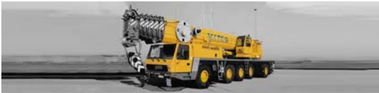
(Macchine operatrici eccezionali)