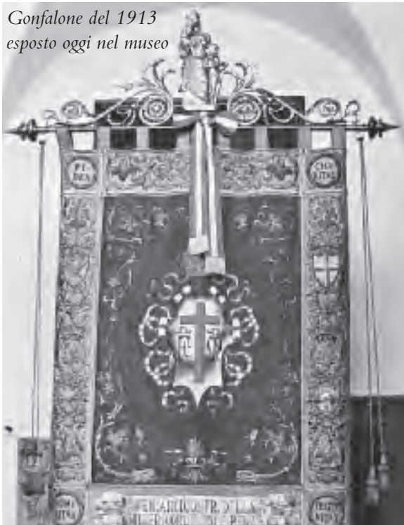
Gonfalone del 1913 esposto oggi nel museo

La necessità di un simbolo di riconoscimento era cresciuta anche a seguito della nascita della Confederazione delle Misericordie avvenuta qualche anno prima, nel 1899. Da quel momento si intensificarono le feste, i convegni, le manifestazioni presso le varie Consorelle toscane con la partecipazione di tutte le altre che si presentavano ognuna con il proprio vessillo. La Società di Mutuo Soccorso cui si fa riferimento era una struttura, nata all'interno della nostra Misericordia, che aveva come scopo principale quello di un maggior legame fra i Fratelli in caso di necessità economiche e per garantire dignitose onoranze funebri.