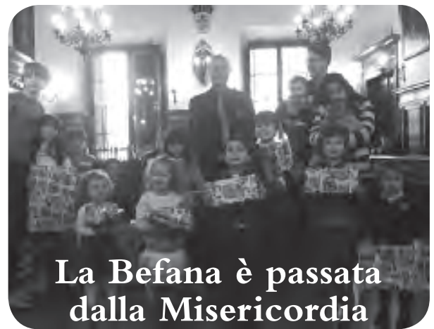
La Befana è passata dalla Misericordia