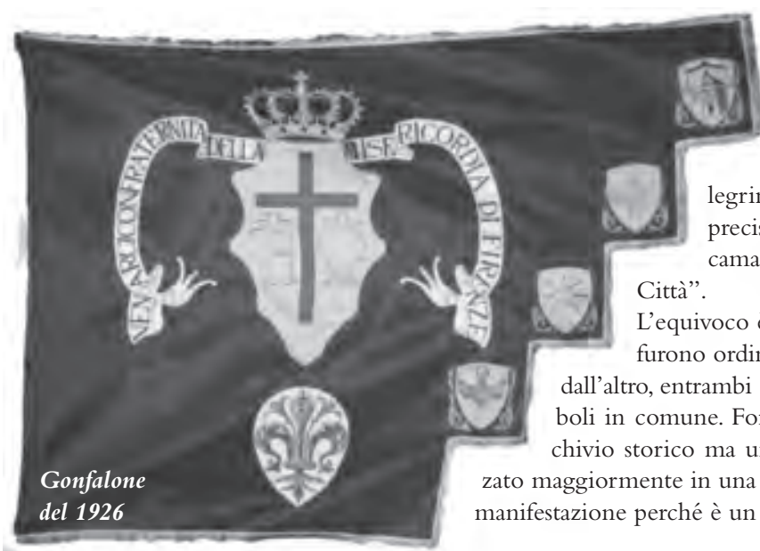
Gonfalone del 1926